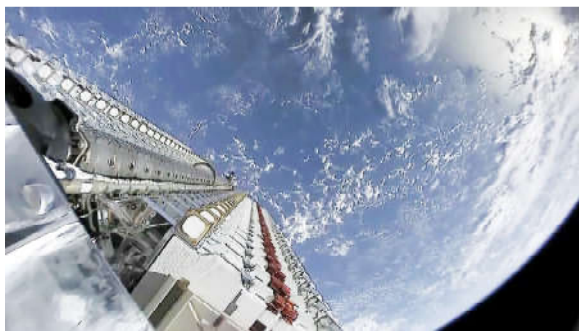
Фото: Official SpaceX Photos - Starlink Mission, ССО (Спутнику Starlink в пакете до отделения от/разгонного блока).